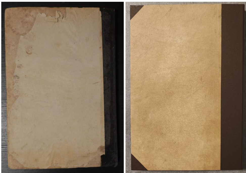
Fig.2: Prima e dopo il restauro: piatto posteriore