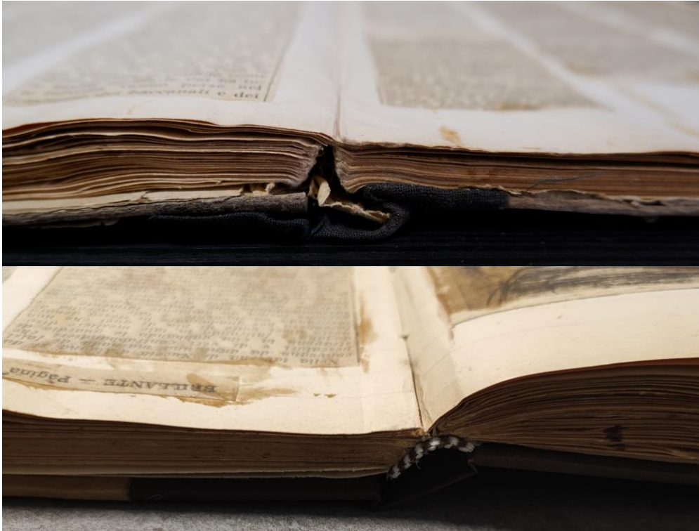
Fig.3: Prima e dopo il restauro: taglio di testa