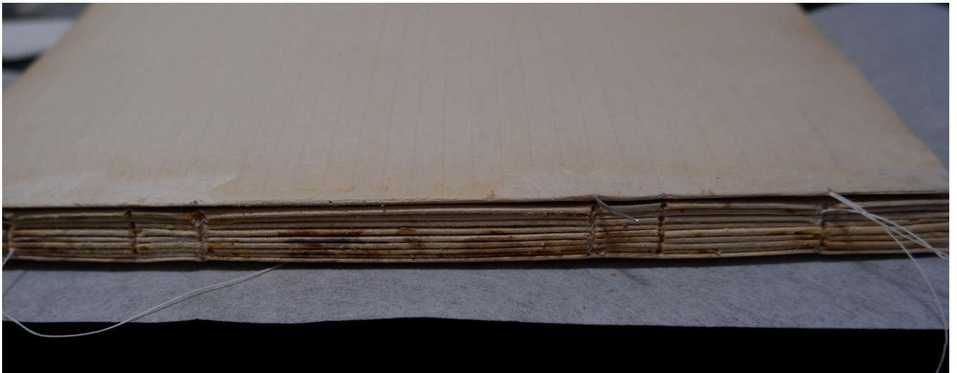
Fig.4: Particolare della cucitura a catenelle